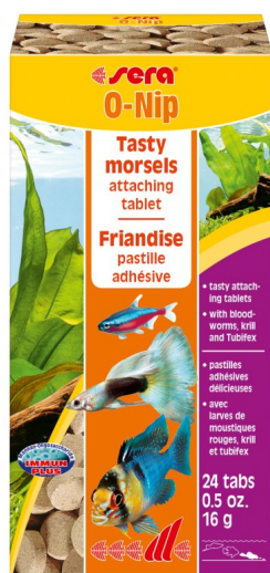
Sera O-nip 24 tabl.